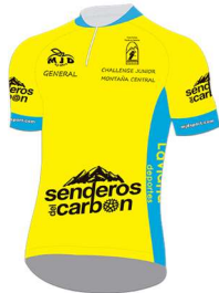
Maillot amarillo: G.P. "SENDEROS DEL CARBÓN" Líder de la Clasificación General