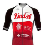
CORBATAS PINDAL CAJA RURAL ASTURIAS