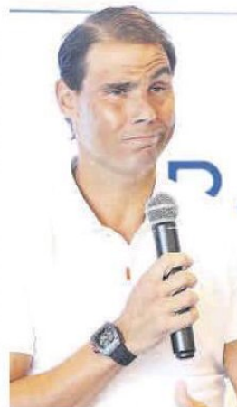
Rafa Nadal, durante la comparecencia de ayer.

Nadal, que saldrá del top 100 por primera vez en su carrera al ausentarse en el segundo grande del curso, insistió en la fragilidad de su