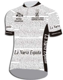
Maillot blanco: La Nueva España Líder de las Metas Volantes