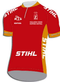
Maillot rojo: STIHL Líder de la clasificación de la Montaña