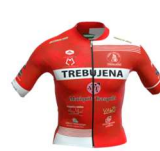
TREBUJENA ACADEMIA LOBATO