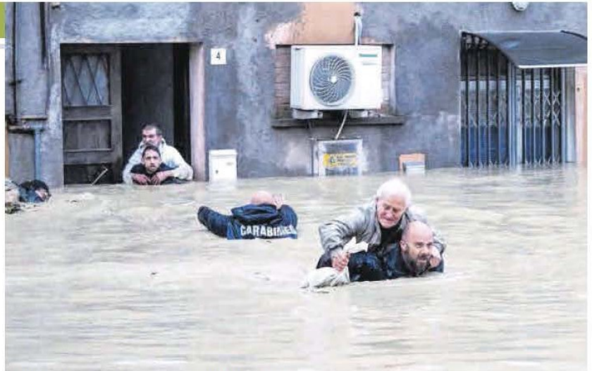
Carabinieri evacuando a vecinos atrapados en Faenza.

Aston Martin, escudería de la que forma parte Fernando Alonso, respaldó la decisión de la FIA, ya que «la seguridad de todos los afectados en la región es lo más importante y debe tener priori-