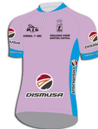
Maillot rosa: DISMUSA Primer junior de primer año clasificado

La empresa asturiana MJD SPORT es la encargada de fabricar y personalizar los maillots que lucen los líderes de las diferentes clasificaciones de la Vuelta a la Montaña Central de Asturias Junior.