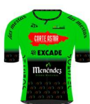
CORTE ASTUR LAS MESTAS