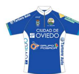
CIUDAD DE OVIEDO TARTIERE AUTO