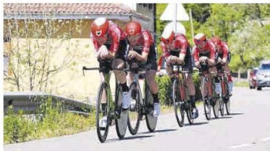
El equipo MMR, durante la contrarreloj por equipos del año pasado.

La tercera jornada de la Vuelta a la Montaña Central, el sábado 20, constará de dos sectores. El prime-