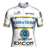
TEAM JUNIOR CIUDAD DE TALAVERA