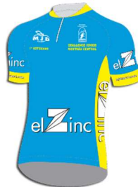
Maillot azul: el Zinc Primer asturiano clasificado