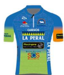
QUESOS LA PERAL