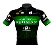
TEAM GRUPO SERMAN