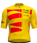
SELECCIÓN DE ARAGÓN