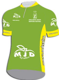
Maillot verde: MJDsport Líder de la clasificación de la Regularidad